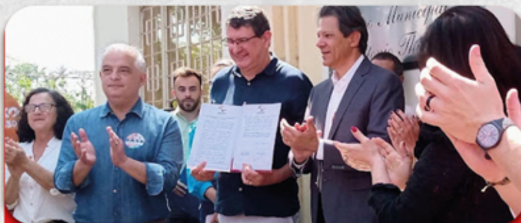
Na foto: (da esquerda para direita: Fátima Celín, Vice-prefeita de Cordeirópolis, Márcio França, candidato ao Senado, Adinan Ortolan, Presidente da AMPPEPSP e Prefeito de Cordeirópolis, Fernando Haddad, candidato ao Governo de São Paulo).

Todas as campanhas receberam o documento e sinalizaram positivamente ao compromisso de manter em andamento as obras que já estejam empenhadas e licitadas, fato que trouxe segurança aos prefeitos e prefeitas de todo o Estado.