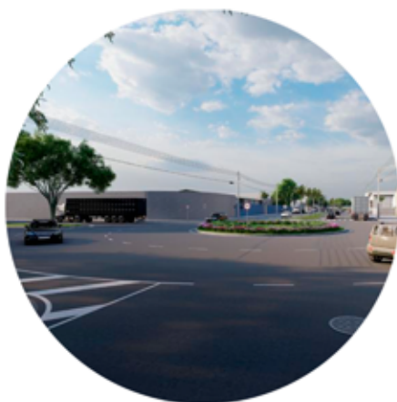
RECAPEAMENTO E CONSTRUÇÃO DE ROTATÓRIAS DA AV. LAURA SÁ LEITE B. MIRANDA IRACEMÁPOLIS/SP