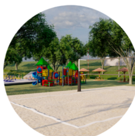
REVITALIZAÇÃO DA PRAÇA DO LAGO DESCALVADO/SP