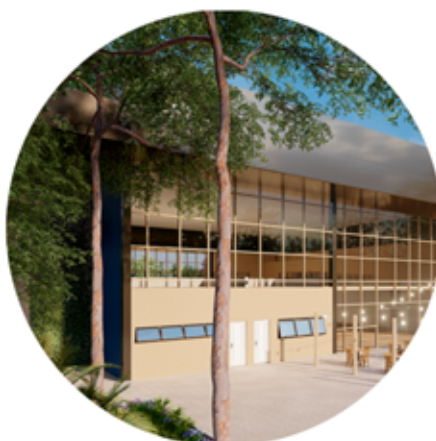
CONSTRUÇÃO DO MERCADO MUNICIPAL ENGENHEIRO COELHO/SP